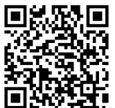
วิดีโอการนำเสนอความสำคัญและแนวทางการเตรียมการจัดทำร่างแผนแม่บทฯ

ร่างแผนแม่บทฯ คาดว่าจะเสร็จ และประกาศใช้ได้