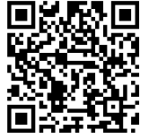
วิดีโอทัศน์เรื่อง "ยุทธศาสตร์ชาติ อนาคตไทย อนาคตเรา"